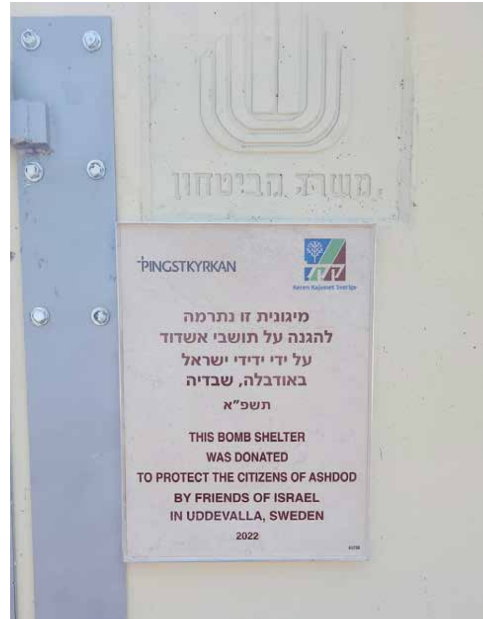
I gränstrakterna mot Gaza har invånarna endast sekunder på sig att söka skydd när larmet går. Nu finns två nya skyddsrum i Ashdod, finansierade av Uddevalla Pingstkyrka.