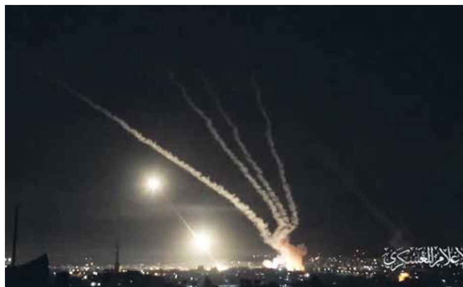
Raketer uppskjutna av Hamas i Gaza från ett tätbefolkat område. Skärmdump från en Hamas-video där de stolt presenterar uppskjutningen av raketer mot civila mål i Israel.

Pingstkyrkan i Uddevalla har en aktiv Israel-grupp som har samlat mellan 90 och 120 personer på sina samlingar. En Israel-konferens i Värnamo för drygt 10 år