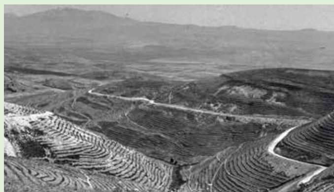
Biriya-skogen som den ser ut idag (bilden till höger) i jämförelse med hur den såg ut för sextio år sedan.

Biriya-skogen planterades på 1940- och 1950-talen på mark som ägdes av Keren Kajemet. Arbetslösa nybyggare anställdes för att plantera träd i området vilket så småningom bland annat resulterade i en skog med miljontals tallar. Sedan staten Israel bildades har Biriya varit ett centrum för skogsplantering i norra Israel.