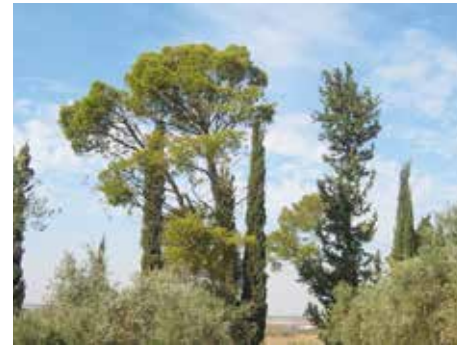
Keren Kajemet har planterat mer än 250 miljoner träd sedan organisationen startade år 1901.

När det är dags att plocka frön går skogsarbetare ut i skogarna, klättrar