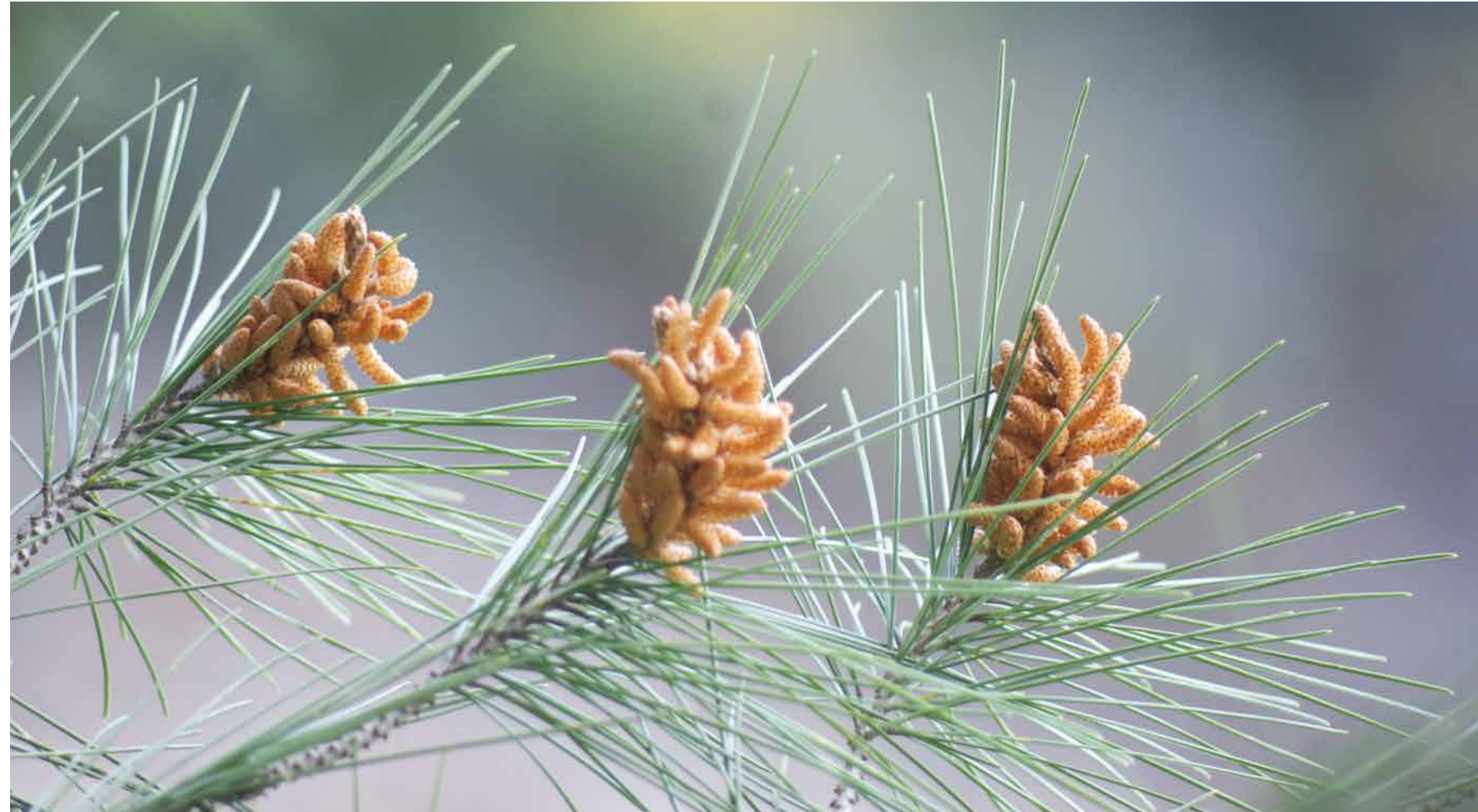
Kottarna bär på frön som ska bli morgondagens trädplantor.