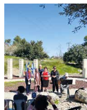
100 träd planterades nyligen i Raoul Wallenberg Park till minne av Eva Epstein.

– Exempelvis samlas många svensk-israeler för att fira midsom-