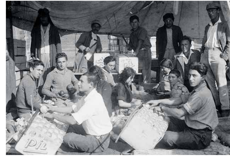
Manuell förpackning av citroner i kuststaden Hadera innan staten Israel bildades.