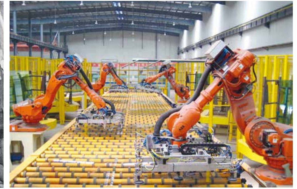
Israeliska företag förser i dag den moderna high tech-industrin med viktiga komponenter.