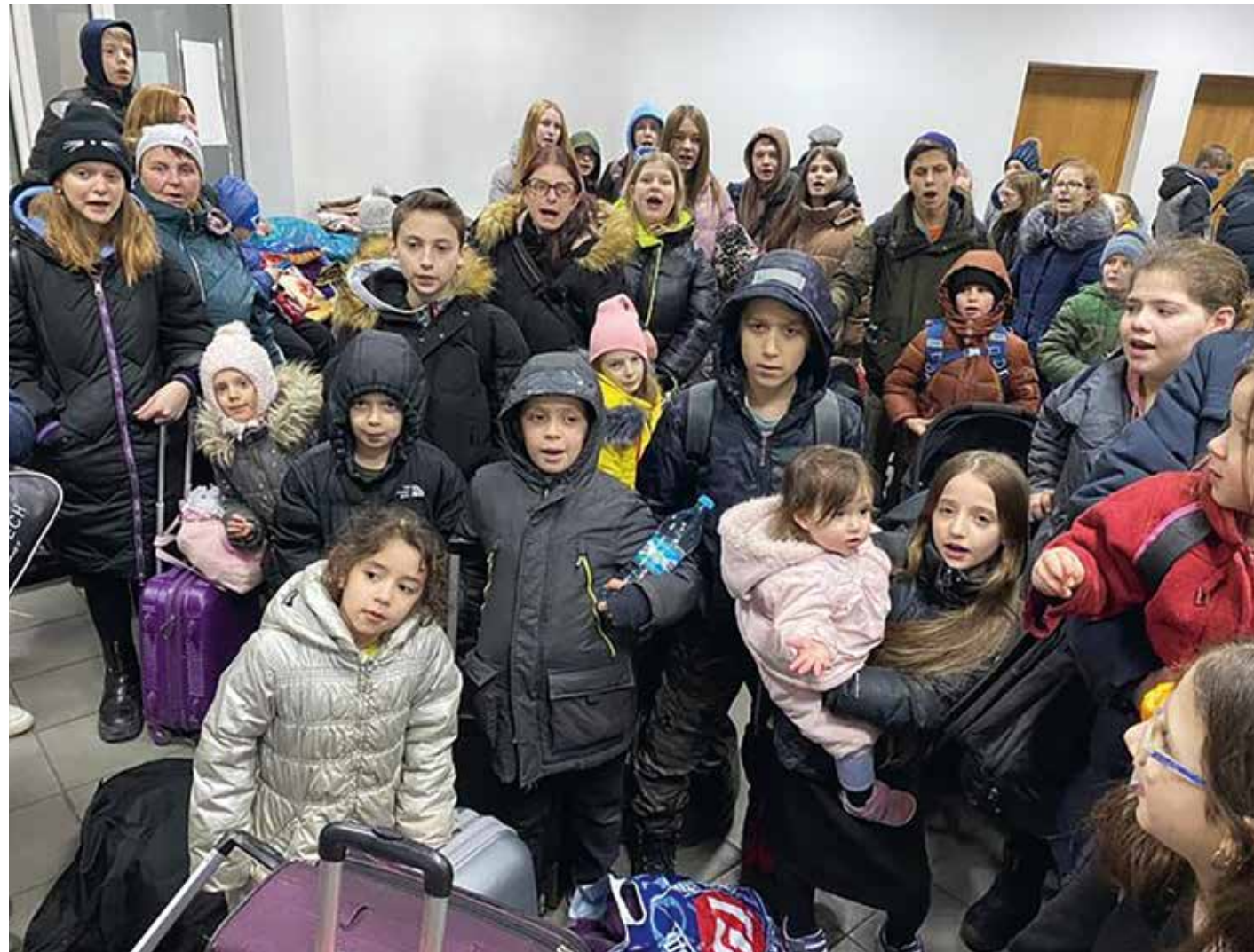
Barnen från barnhemmet i staden Zhytomyr vid gränsen till Ukraina, på väg till Israel.

judarnas förtryckare från deras ansvar." – Som jag redan har sagt, inget krig idag är Förntelsen och inte heller som Förntelsen. Användningen av Förntelsen av judiska folket som en politiskt slagträ måste stoppas omedelbart, fortsatte han.