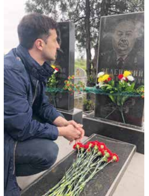
President Volodymyr Zelensky föddes av judiska föräldrar och förlorade delar av sin familj i Förntelsen. Utrikesminister Lavrov förklarade kriget mot Ukraina genom att påstå att Zelensky har judiskt blod "precis som Hitler".

Ledaren vågade inte uttala sig offentligt eftersom han fruktade för sitt liv, då han avsåg att återvända till Ryssland i framtiden och därmed inte kunde uttala sig mot kriget i Ukraina.