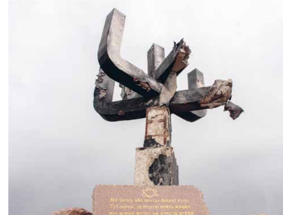
Ryska bomber har förstört ett monument för Förntelsens offer nära Charkiv (bilden) liksom minnesplatsen Babi Yar utanför Kiev där drygt 30 000 ukrainska judar sköts ihjäl av nazityska Einsatzgruppen.

Segerdagen firas med anledning av andra världskrigets slut i Europa, då nazisterna undertecknade den tyska kapituleringen. Även om dagen firas i hela Europa och även i Israel, förvandlade Rysslands president Vladimir Putin den