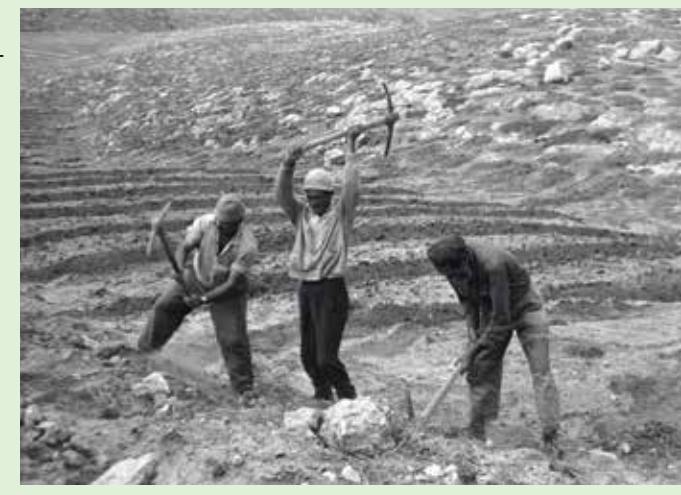
Yatirskogen, som området såg ut på 1960-talet, i jämförelse med hur det ser ut i dag.

Området har en genomsnittlig årlig nederbörd på 300–350 mm och har låg luftfuktighet. Israel är ett av få länder i världen där inte öknen breder ut sig.