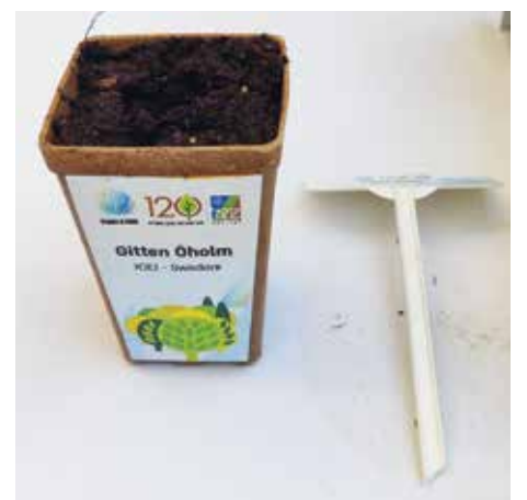
Gitten Öholms kruka väntar på sin planta.

– Varje land har sin egen relation till Israel. Det var glädjande att höra hur exempelvis statsöverhuvuden i Tjeckien och Albanien har en mycket positiv inställning och representanten från Danmark berättade om ett bra samarbete mellan rabbinen och biskopen. Bakgrunden var bland annat att biskoparna tog hand om tora-rullarna när de danska judarna tving-