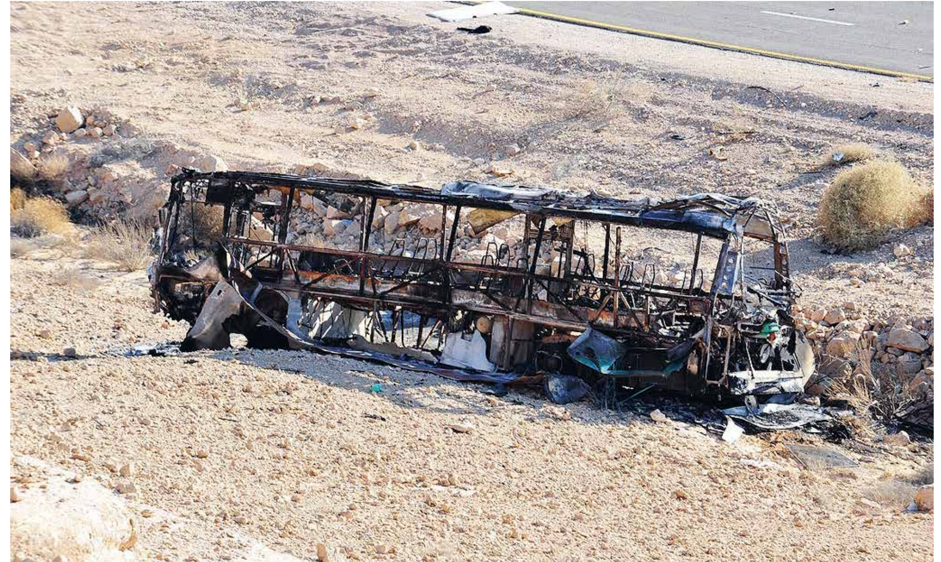
Palestinska terrordåd som riktas mot civila har varit vardag för Israel sedan staten bildades. Bilden visar resterna av en buss efter en terrorattack i augusti 2011 mot israeliska civila som var på väg till Eilat för sommarsemester.

Israel bygger en blomstrande ekonomi och en vibrerande demokrati – med fri val, yttrandefrihet, pressfrihet, religionsfrihet och ett fristående rättsystem – i närvaro av några av världens mest repressiva regimer och mest brutala terrororganisationer.