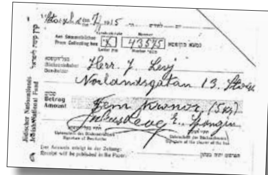
En redovisning från Landskrona summeras till 29 kr och 91 öre, fördelat på 18 bössor. Sverige tog i början av förra

En S. Abel på Storkyrkobrinken 8 i Gamla Stan i Stockholm som drev ett portföretag, ko-