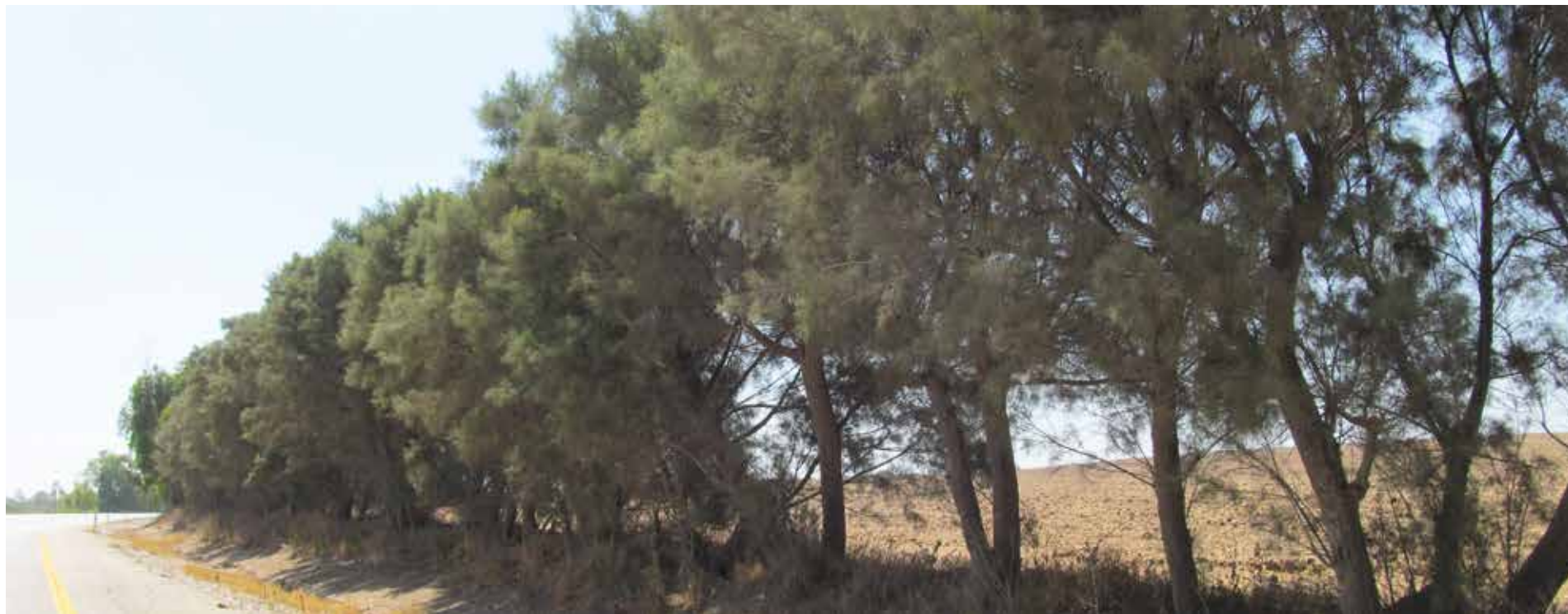
Snabbväxande träd ska fungera som kamouflage och skydd för krypskyttar.