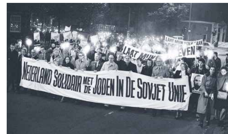
Ett fackeltåg i Amsterdam, Nederländerna, som i oktober 1983 demonstrerar för judarna i Sovjetunionen.

Rättegången och de hårda straffena mot Sharansky och andra judar som kämpade