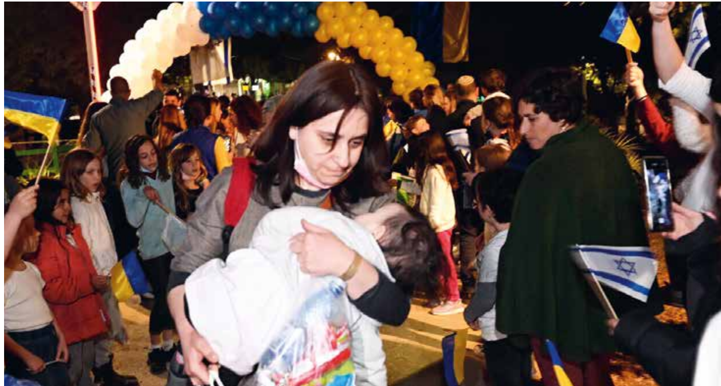
Sedan Ryssland invaderade Ukraina till mitten av maj har uppemot 20 000 judar från Ukraina och Ryssland anlänt till Israel, enligt israeliska myndigheter.

I det mest uttryckliga fördömandet av en rysk tjänsteman sedan kriget mot Ukraina började, uttalade sig premiärminister Naftali Bennet mot Rysslands utrikesminister Sergey Lavrovs påståenden. Bennet sa att "lögner som dessa är avsedda att beskylla judarna själva för de mest fruktansvärda brotten i historien, som begicks mot dem, och därmed befria