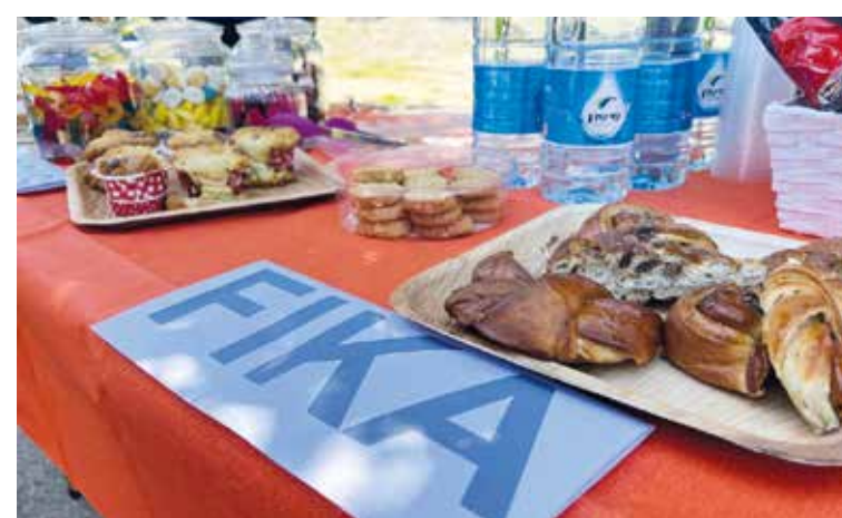
Tel Aviv-företaget Fika skickade ut sin "foodtruck" till Raoul Wallenberg Park så att gästerna kunde njuta av svenska bakelser och kakor till kaffet.

Evas dotter Cecilia berättar att Eva var en sportig person som simmade med Cecilia i poolen