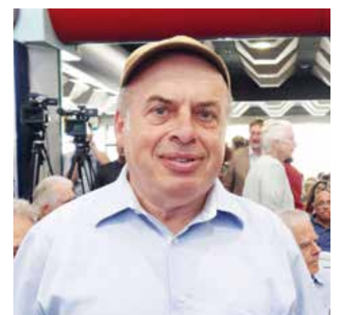
Natan Sharansky, en av de mest kända av alla sovjetiska refuseniks, har varit minister i flera israeliska regeringar och har dessutom varit ordförande för Jewish Agency.

I samband med Glasnost och Perestrojka öppnades gränserna och mellan 1989