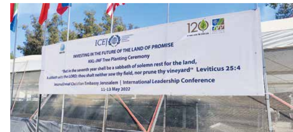
ICEJ-ledare från ett 30-tal nationer planterade ek-träd inför årets Lövhdyddfest i oktober som har temat "Att bygga landet".

– Sverige hade länge en god relation till Israel, många jobbade på kibbutzer under landets första decennier och Sverige skickade även stugor till landet på 1950-talet.