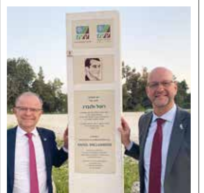
Den svenske diplomaten Raoul Wallenberg är en av världens mest kända svenskar och även en nyckel när det gäller Sveriges relation med Israel.