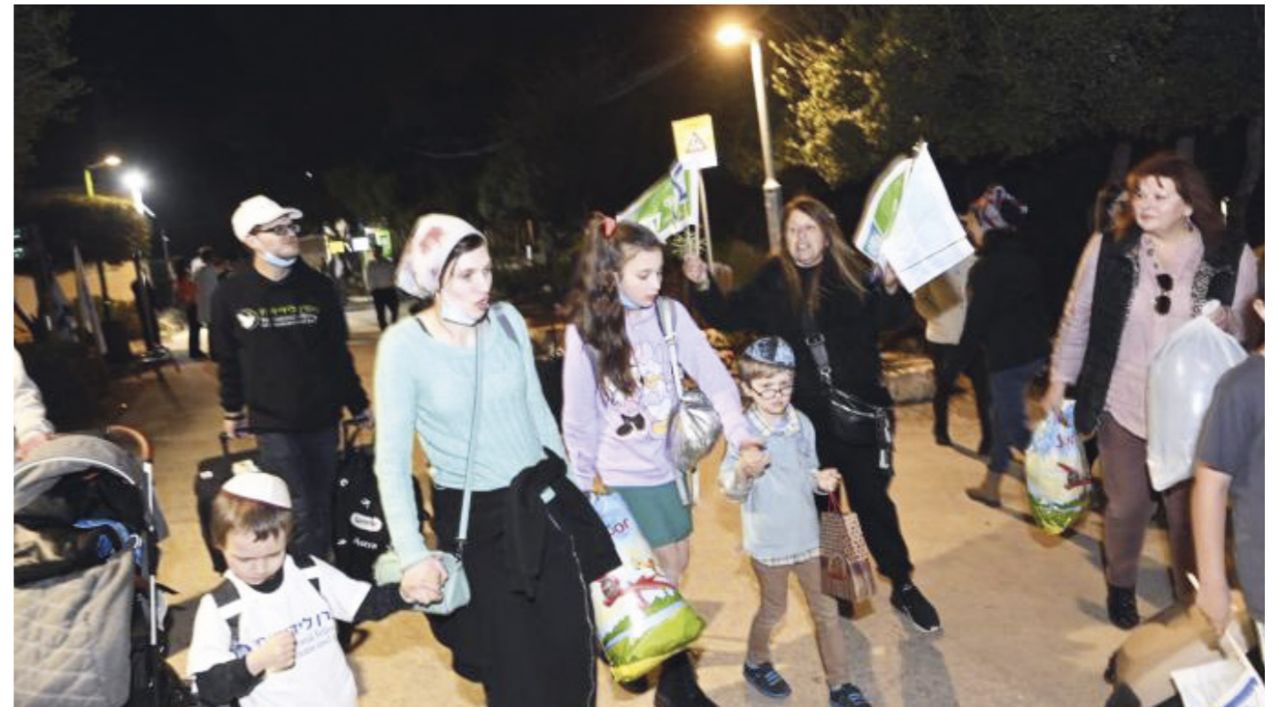
Keren Kajemet välkomnar judar från Ukraina till Israel.

Med hjälp av vårt kontor i Tjeckien gav Keren Kajemet hjälp vid gränsen mellan Ukraina och Slovakien genom att föra judiska flyktingar till säkra platser. I Ungern hjälpte Keren Kajemet dussintals judiska familjer att hitta bostad i hotell och lägenheter och genom att ge personligt humanitärt stöd. Genom den ungerska grenen av Hashomer Hatzair-rörelsen köpte Keren Kajemet generatorer, tält och ytterligare humanitärt bistånd till rörelsens medarbetare i hela landet.