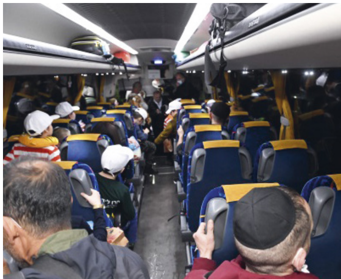
Judiska barnhemsbarn från Ukraina flygs till Israel.

Dessvärre finns det fortfarande stater som menar att Israel inte skall finnas och