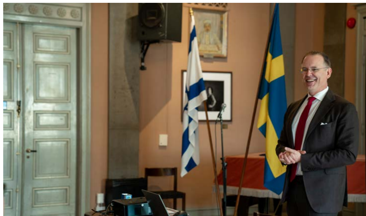
Anders Borg berättade om hur engagemanget för Israel har funnits sedan barnsben