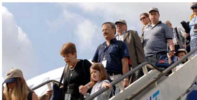
Israel är garanten för förföljda judar.

Det är svårt att förstå hur svenska medier kan ta Islamiska Jihad under armarna genom att osynliggöra 1200 missiler mot den israeliska civilbefolkningen så att rapporteringen istället fokuserar på Israels reaktion – som ju blir