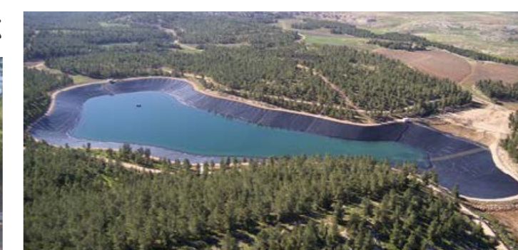
Yatir-skogen är den största skogen i Israel.