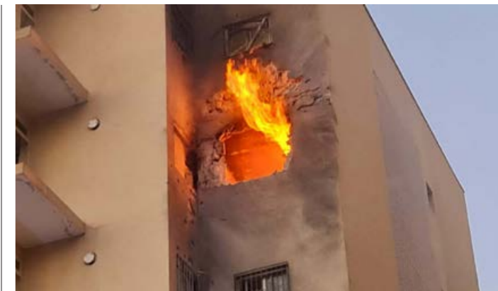
Bild från 2021 då ett hus i Sderot träffades av Hamas raketbeskjutning vilket dödade femåriga Ido Avigal.

– I Sverige finns märkligt nog färre statyer och platser i Raoul Wallenbergs namn än i USA. I New York finns det åtta