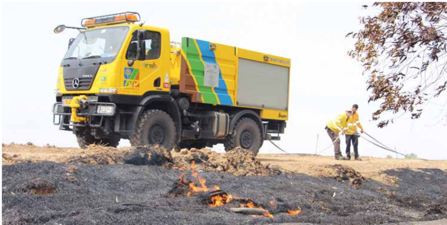
Att stödja KKLs arbete med att plantera och underhålla skog har alltid varit ett av de mest meningsfulla uttrycken för solidaritet med Israel hos KKLs vänner och anhängare runt om i världen.

Att stödja trädplantering, brandbekämpning, skogsvård och miljövård är ett konkret sätt att