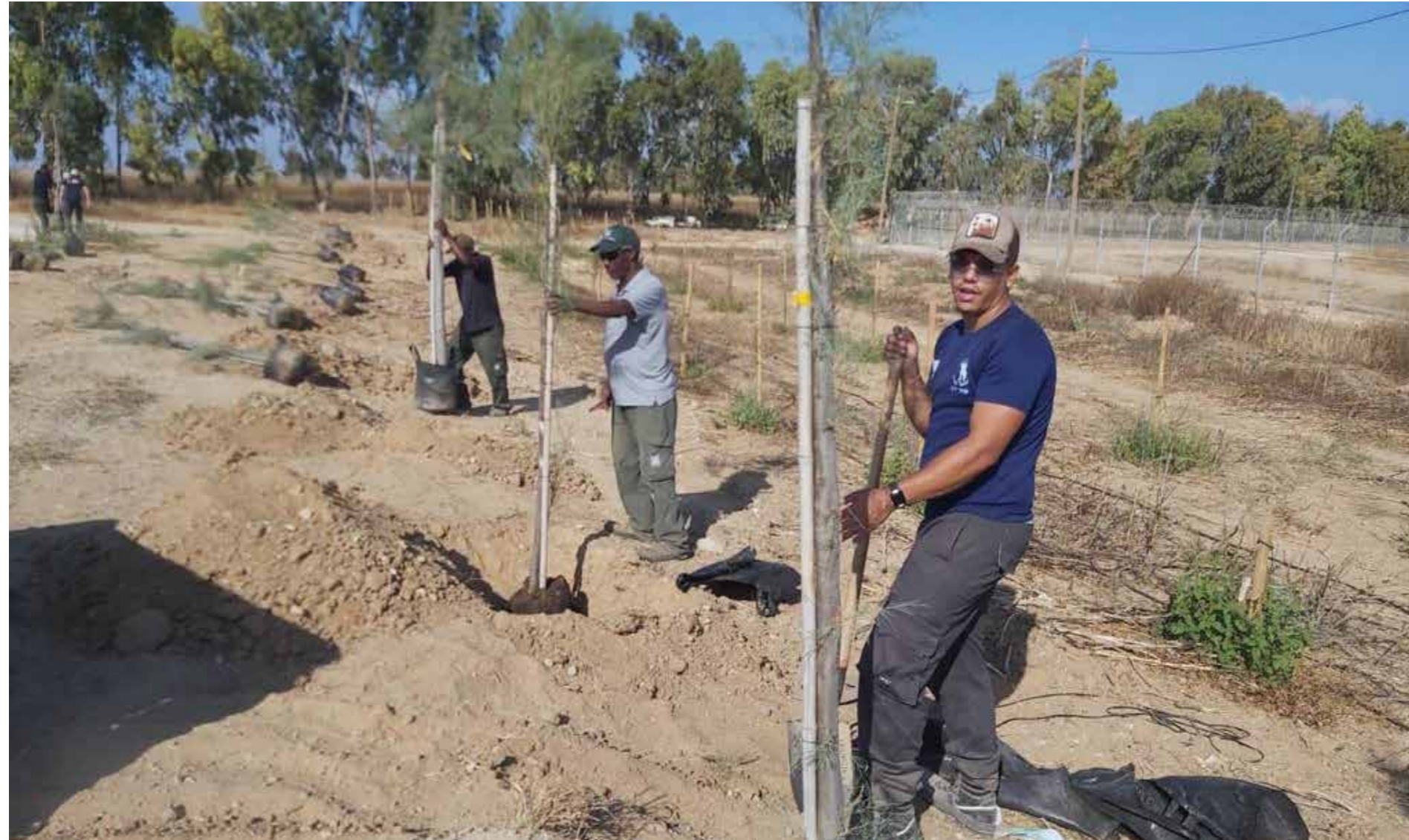
126 trädbarriärer som är mellan 250 till 4500 meter långa har planterats av KKL vid gränsen till Gaza.