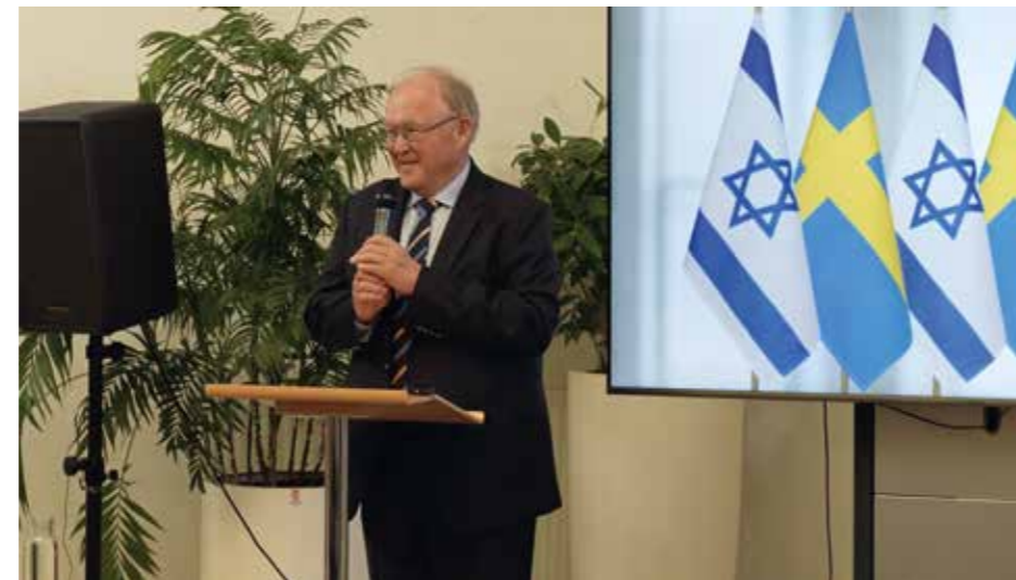
Göran Persson betonade att hjärtat blir fullt när Israel firar 75 år.