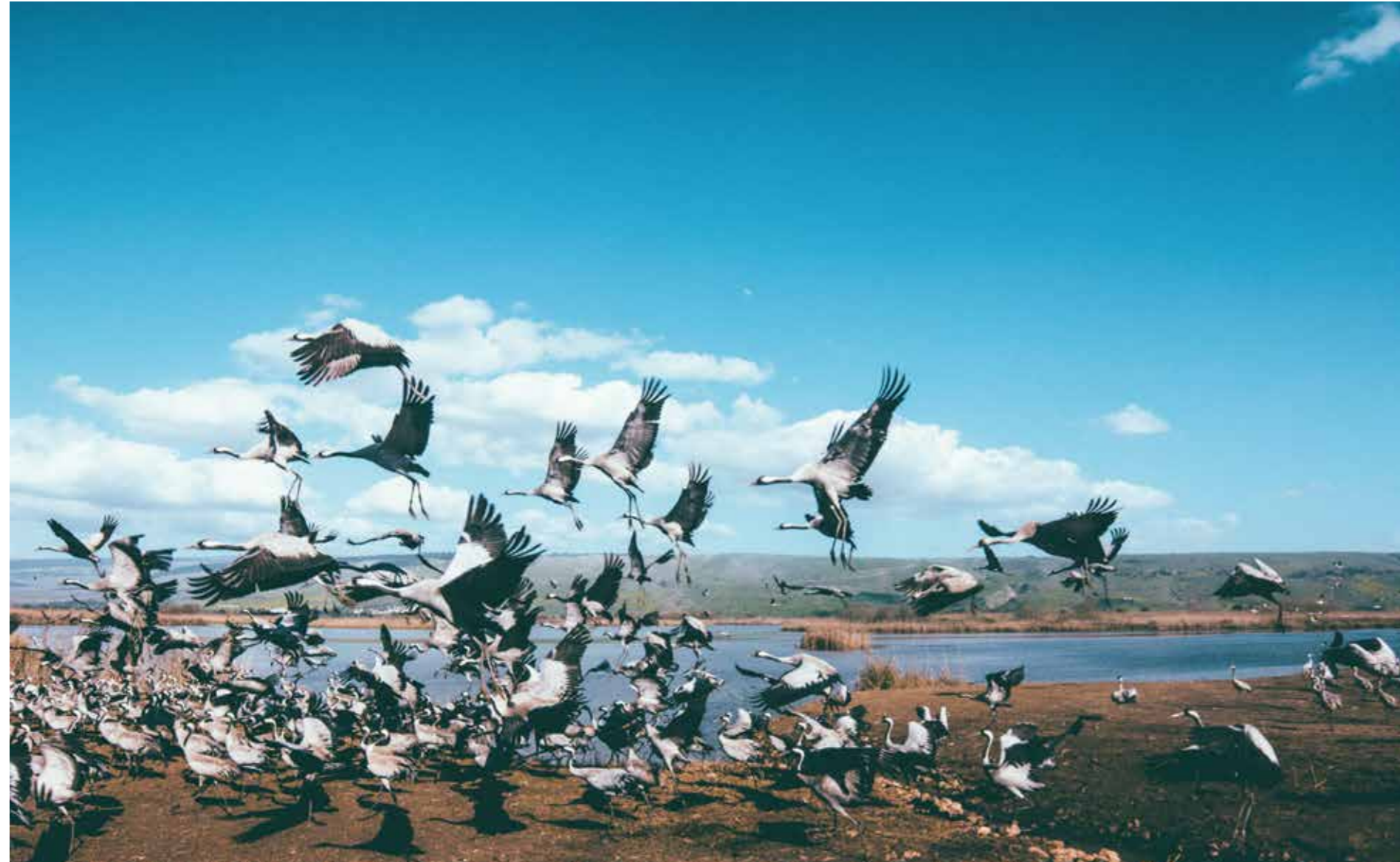
Mot kvällen kommer storkarna ner för att vila vid Hulasjön.