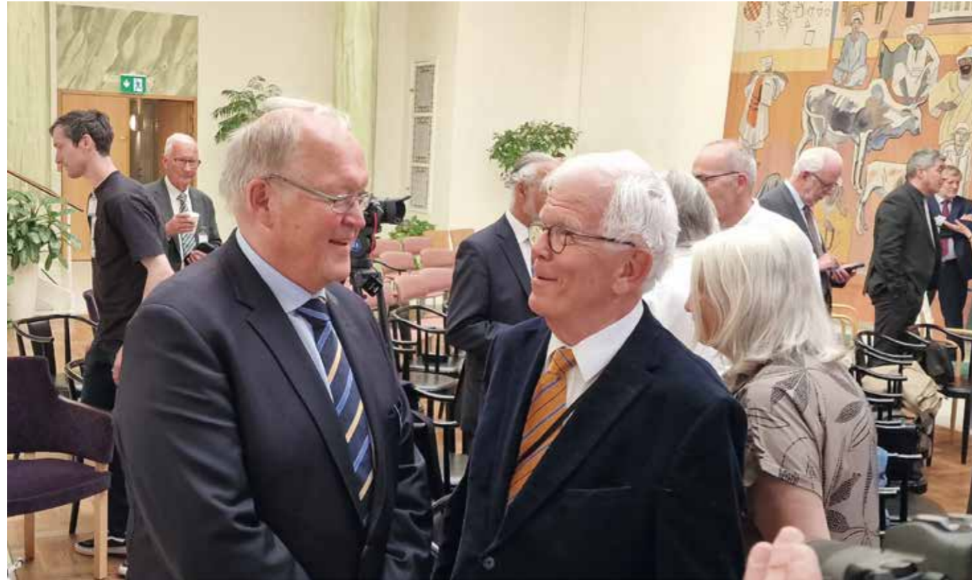
Göran Persson och Alf Svensson möttes i riksdagshuset när Israels 75-årsdag uppmärksammades.

Alf Svensson tackade sedan Göran Persson för ett mycket bra tal.