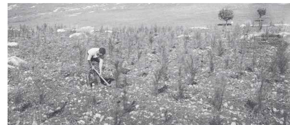
Att plantera träd har varit en del av Keren Kajemets kärnverksamhet sedan starten 1901.

Om ni som turistgrupp eller du som privatperson vill plantera träd i Ben Shemen-skogen, kontakta Keren Kajemets Sverige-kontor på telefon 08-661 8686 eller e-post: info@kkl.nu så ordnar vi alla praktiska detaljer.