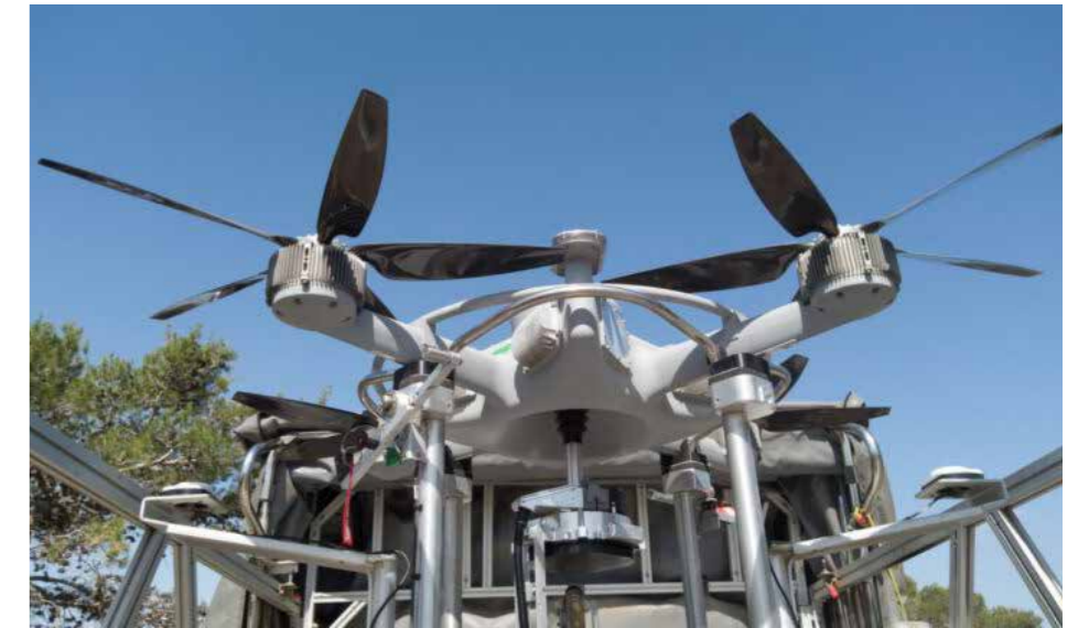
En kameradrönare som kan sväva upp till 100 meter över marken kartlägger små lågor som kan utvecklas till skogsbränder.