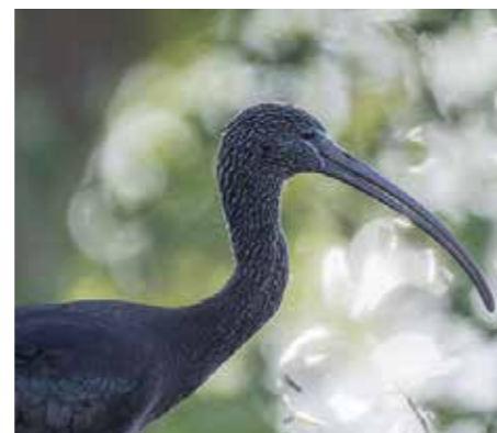
Bronsibisen påminner i formen om en stor spov. Bronsibisen har sedan 1980-talet så gott som varje år observerats i Sverige.

De flesta fåglar flyttar på natten, och allt som vittnar om deras ankomst är ropen och sången från gräset och träden. En blick i turkos färg avslöjar kungsfiskaren, en snabb springare i gräset är ingen mindre än den gula ärlan. Vid soluppgången