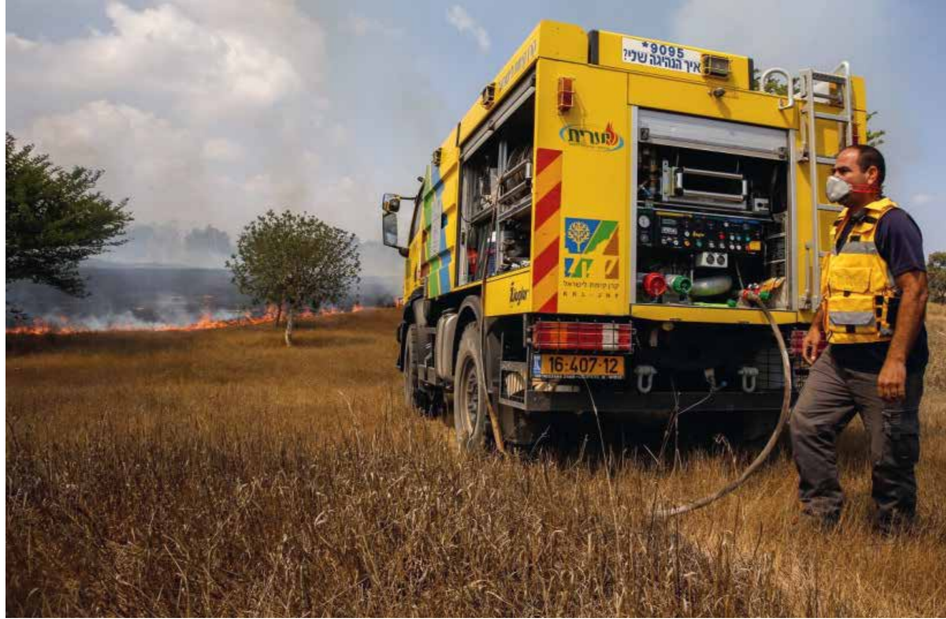
Keren Kajemet och Israels brand- och räddningstjänst arbetade tillsammans för att förhindra att bränderna spreds.