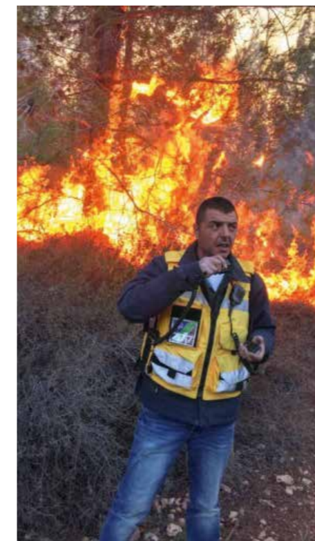
Det viktigaste vapnet mot skogsbränder är att jobba förebyggande.

Hela systemet tillverkas i Israel, i en fabrik i Yokneam. KKL hyr systemen av dem, vilket innebär att erfarna proffs kan utnyttja systemets fulla kapacitet. För närvarande finns det två system i drift, och målet är att utöka systemet till att täcka fler områden av Israel.