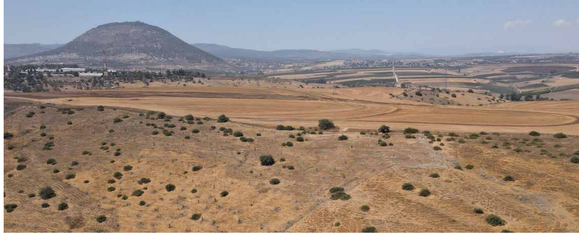
Den nya skogen ska planteras i nedre Galileen, nära Taborberget, i ett område med lite skog och begränsad växtlighet.