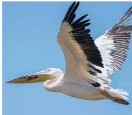
Pelikanerna anländer från Donaus mynning och landar på Hulasjöns vatten. De är de största fåglarna som vandrar på detta sätt.

Området lockar en mängd olika flyttfåglar som tranor, pelikaner och flamingos under migrationssäsongerna.