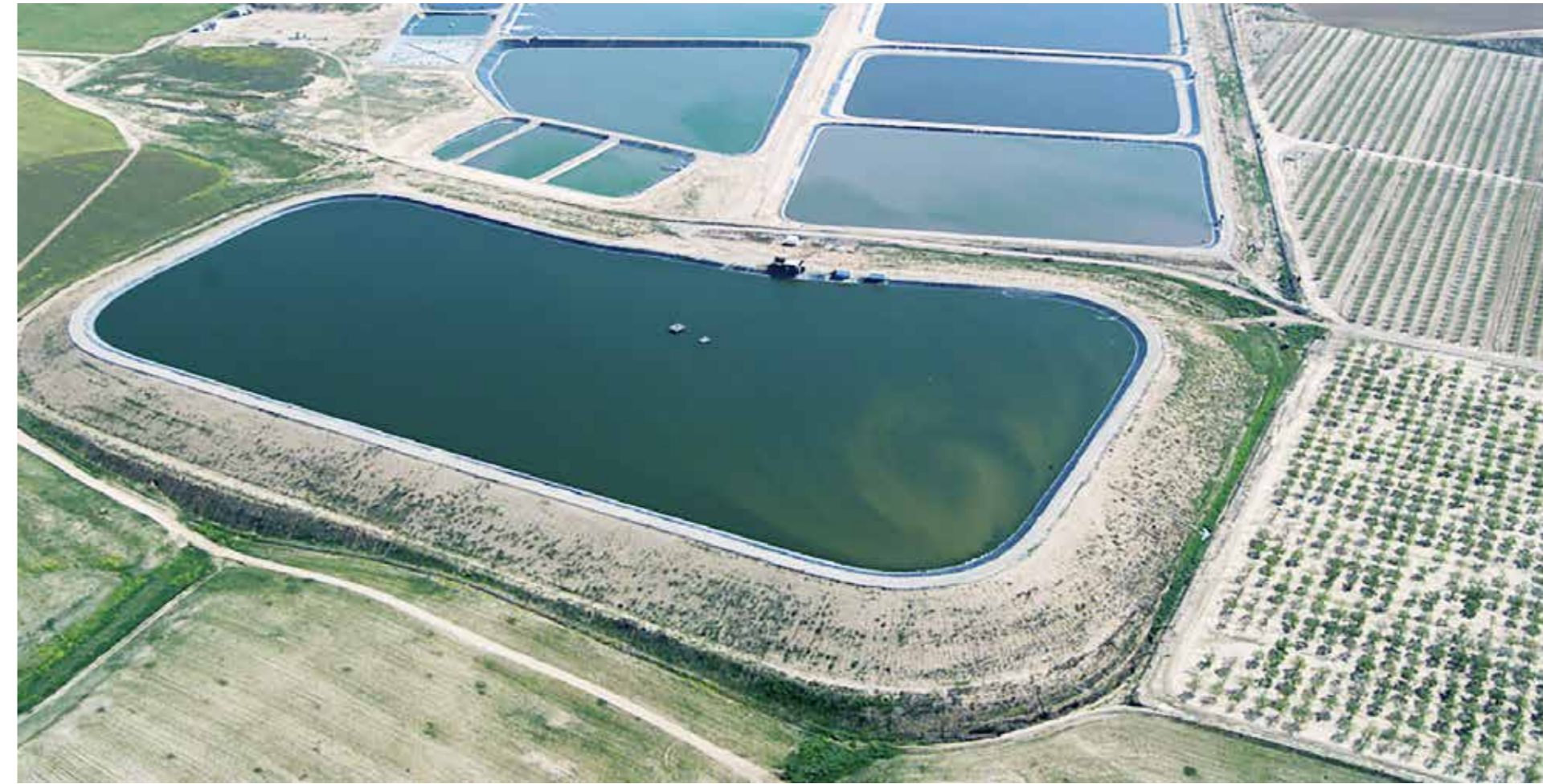
Arad-reservoarens lagringskapacitet har utökats till 740 000 kubikmeter.

Omfattande forskning visar att människor som bor nära skogar lider mindre av ångest och depression tack vare närheten till naturen och förmågan att koppla av, träna, umgås och njuta av alla fördelar som naturen erbjuder. □