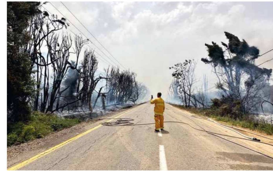
En medarbetare på KKL-JNF förhindrar spridningen av en skogsbrand den 2 juni 2023.