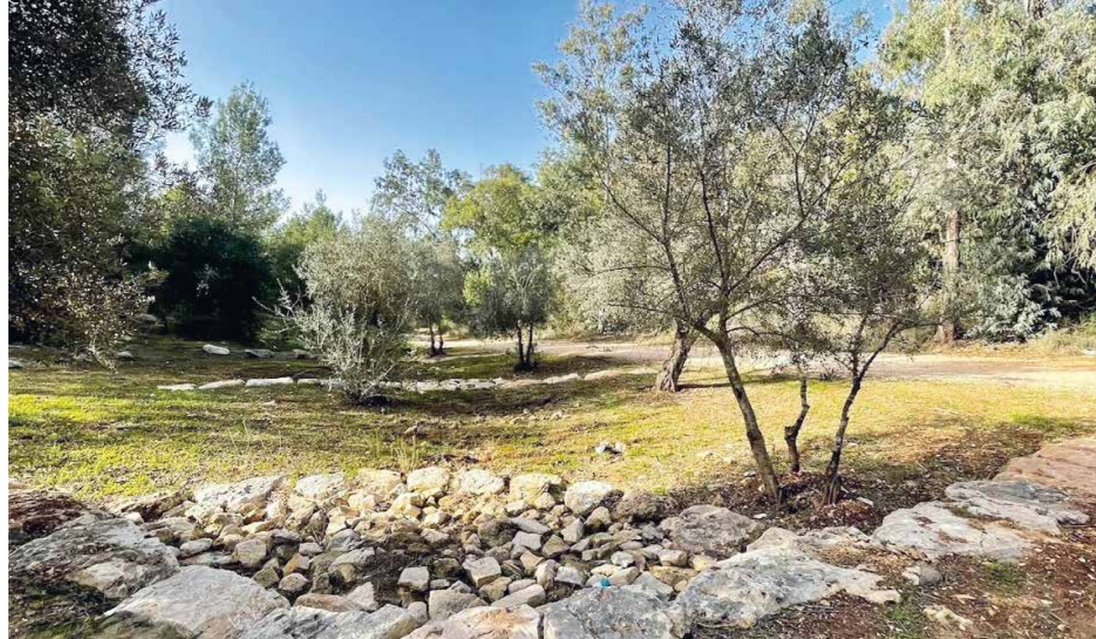
Besökare kan kombinera rekreation med en rundtur på arkeologiska platser.