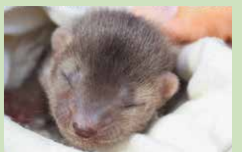
Sedan grundandet 2019 har AWRC behandlat över 660 vilda djur, av 196 djurarter.

På Agamon Wildlife Rehabilitation Center arbetar erfarna veterinärer och djurvårdspersonal outtröttligt för att ge bästa möjliga vård för varje skadat djur som kommer genom dess dörrar. Från rovfåglar och små däggdjur till reptiler fungerar AWRC som en fristad för djur i nöd.