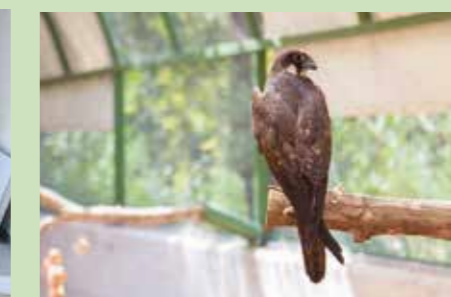
AWRC finns i Hula-dalen, som passerar av hundratals miljoner fåglar på resorna mellan Europa och Afrika.