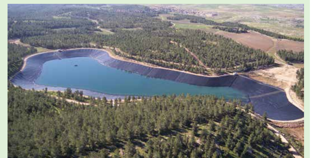
En hållbar vattenförsörjning är förutsättningen för skog och odlad mark.