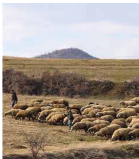
Området lider av intensivt betande boskapsbesättningar i närheten.

Under de kommande fem åren kommer den nyplanterade skogen att kräva noggrann och uppmärksam vård av KKL-expert som tillhandahåller kompletterande bevattning, ogrärensning och