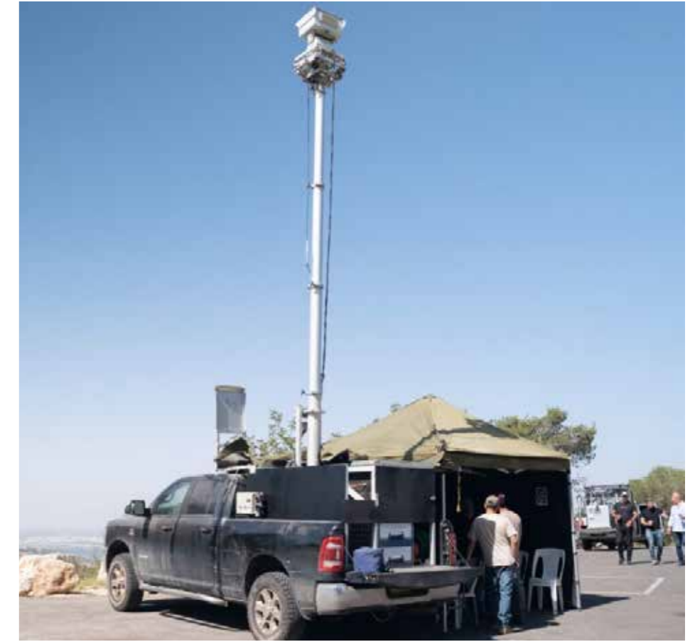
En 10 meter hög mobil mast ska bidra till att skogsbränder ska kunna upptäckas tidigare, vilket underlättar släckningsarbetet.

KKL är Israels största miljöorganisation och den äldsta miljöorganisationen i världen. KKL främjar projekt i Israel inom områdena skogsbruk och miljö, vattenekonomi, utbildning, samhällsutveckling, turism samt forskning och utveckling inom jordbrukssektorn.