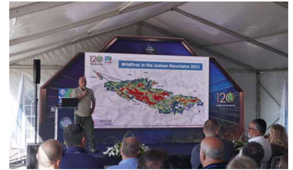
Under KKL:s världskongress i slutet av förra året visades en översikt över bränderna i Jerusalem-regionen år 2021.