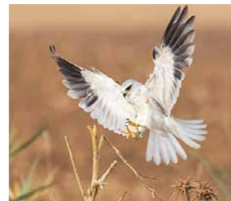
En svartvingad glada har gjort sig redo för landning. Denna vackra rovfågel har endast påträffats ett fåtal gånger i Sverige.

I lugn och ro mitt ibland dem simmar alla sorters ånder, en del av dem anländer på hösten, som årtan, och andra som kommer för att stanna över vintern, som krickorna, ankorna, gräsänderna