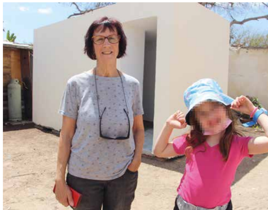
Tack vare KKL-vänner över hela världen har KKL under det senaste året kunnat placera ut över 100 nya skyddsrum.

Med stöd av vänner över hela världen, spelar KKL en viktig roll för att utveckla och stärka de västra Negev-samhällena och invånarna, särskilt under tider av svårigheter, konflikter och krig.