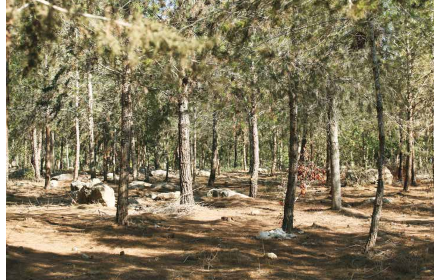
Ben Shemen-skogen exemplifierar den sionistiska drömmen och dess förverkligande.