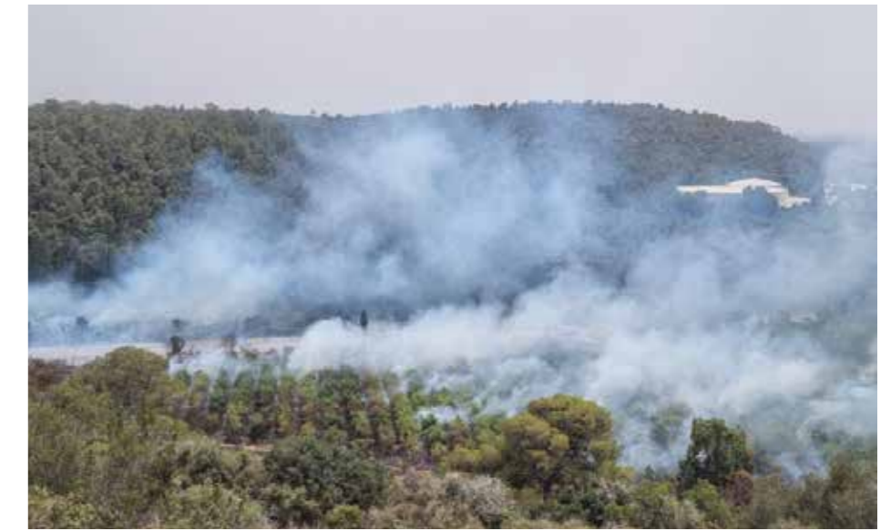
Skogsbrand i Moshav Kerem Maharal den 2 juni.