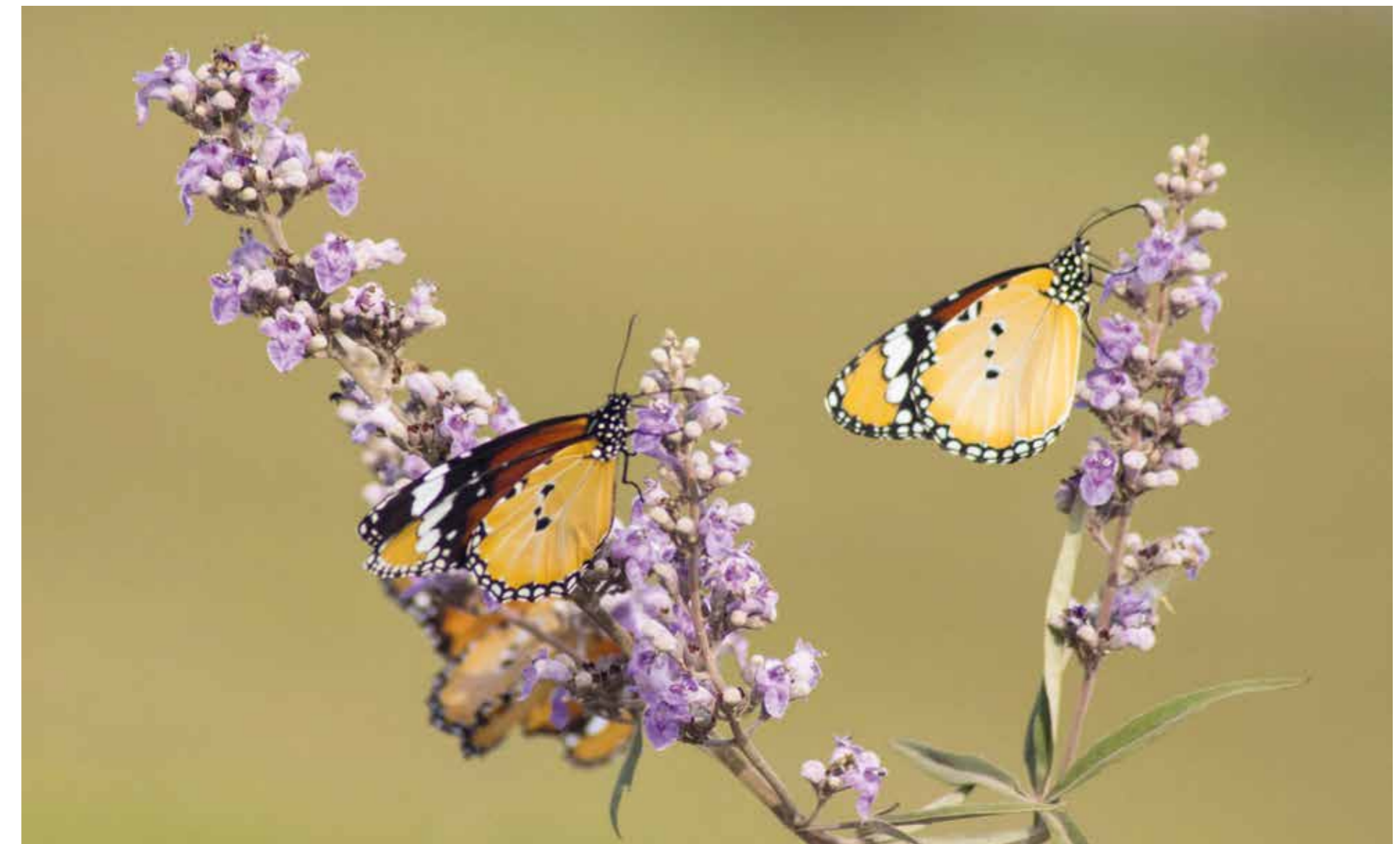
Tiotusentals fjärilar anländer från det avlägsna Afrika och färgar Hula ljust orange.