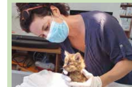
Agamon Wildlife Rehabilitation Center (AWRC) är ett samarbete mellan KKL-JNF och Tel-Hai College.