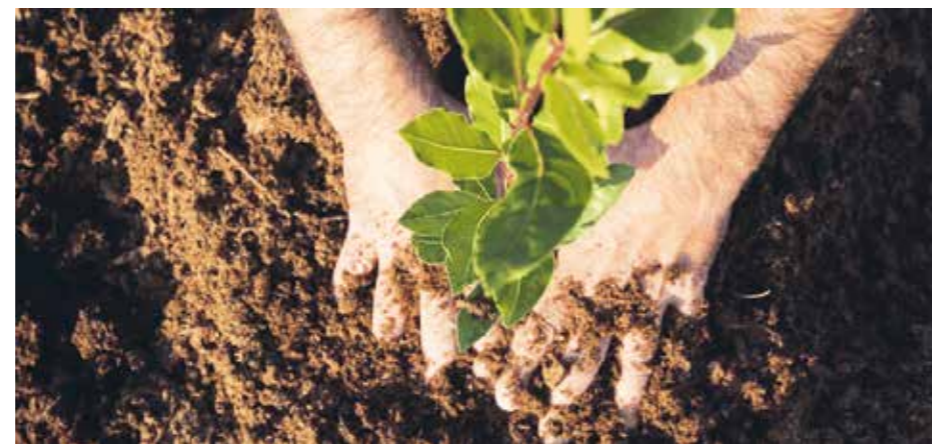
I Ben Shemen-skogen finns ett trädplanteringscenter för turister. Kontakta Keren Kajemets Sverige-kontor om du/ni vill plantera träd under er Israel-resa.

Keren Kajemet, som satte handen till plogen, för att förverkliga denna dröm, började köpa mark i Israel år 1907 och fortsatte med att förbereda landet för skogsplantering och för bebyggelse. Ben Shemen-skogen var det första och är det största skogsplanteringsinitiativet i staten Israels historia. När Keren Kajemet köpte marken år 1907, planterades olivlundar där, men avkastningen levde inte upp till förväntningarna, så experterna beslöt att