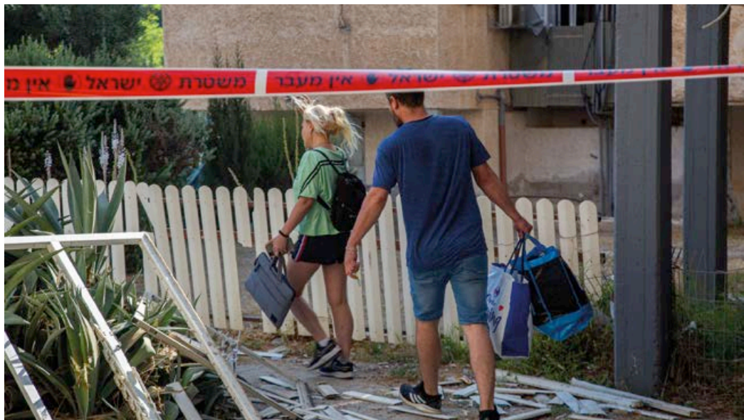
Aldrig förr har så många civila israeler drabbats av en sådan här mardrömslik situation.

KKL Israelfonden var först på plats i gränsområdet med hjälp till nödlidande. Vi har evakuerat barnfamiljer till säkrare platser vid våra anläggningar. Genom att ta hand om barn och ungdomar har vi skapat