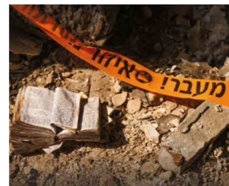
En raket från Gaza träffar lägenhet i Ashkelon 9 oktober.