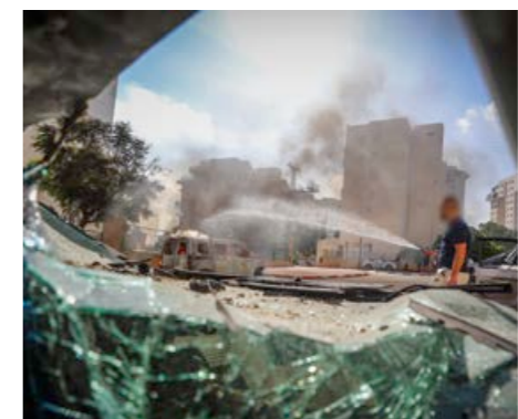
En missil avfyrad från Gaza orsakar skada i Ashkelon.