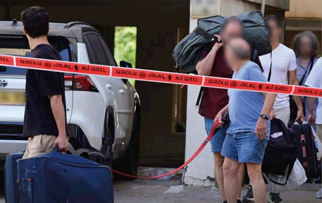
Familjer evakueras från krigszonen i södra Israel