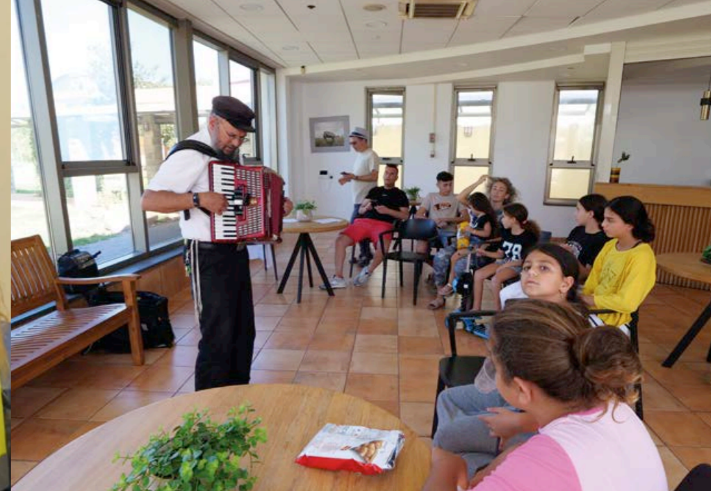
KKL hjälpte till att evakuera Sderots invånare efter terrorattacken.