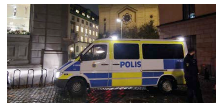
Polisbevakning utanför Judiska församlingen.

sett en ökad antisemitism. Det började med att terrorattacken firades. Propalestinska grupper har därefter ordnat demonstrationer där Nordiska motståndsrörelsen och kommunistiska grupper deltagit.