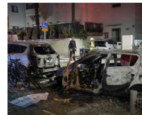
En-raket avfyrad från Gaza träffar fordon i Tel-Aviv.