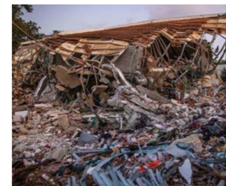
Förödelse efter Hamas-terroristernas framfart i kibbutz Be'eri.