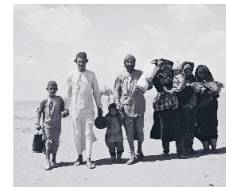
I arabiska städer som Aleppo, Aden, Oujda, Jerada, Kairo, Bagdad och Tripoli utfördes massakrer på judar vilket fick dem att fly till Israel.

På morgonen den 7 oktober 2023 blev kibbutzen som grundades av irakiska judar som flydde efter Farhud-massakern invaderade av terrorister och Hamas-anslagare från Gazaremsan som mördade mer än 1100 och kidnappade 248 människor. Många samhällen förstördes, inklusive delar av kibbutz Be'eri, som förlorade mer än 130 av sina invånare. Många mördades bland de tusentals människor som befann sig på musik-