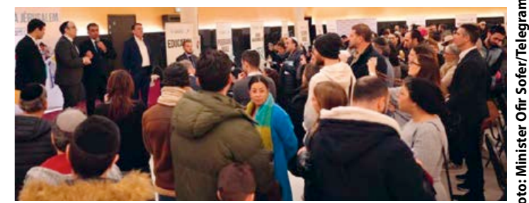
Israels Aliyahminister Ofir Sofer talar vid en Aliyah-mässa som hölls söndagen den 17 december 2023 i Paris.