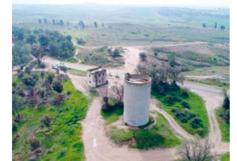
Säkerhetshuset från den gamla kibbutzen ligger fortfarande kvar i skogen. Kulhålen i säkerhetshuset är från självständighetskriget år 1948.

festivalen "Nova" som anordnades i Be'eri-skogen, den första skogen som planterades av Keren Kajemet Israelfonden i Negev.