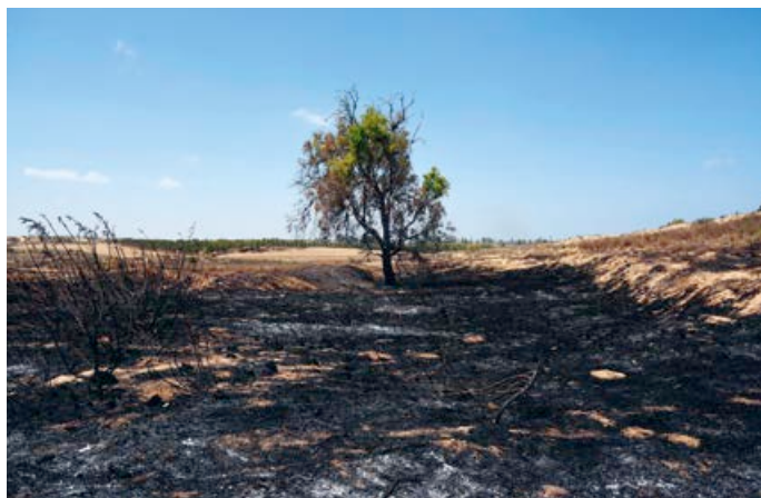
Keren Kajemet ska nu återplantera ca 50 hektar skog i Be'eri-skogen som förstörts under den senaste tidens attacker från Gaza.

Små barn som intervjuas och säger att deras mål är att "döda alla judar". Samtidigt som det är självklart att det