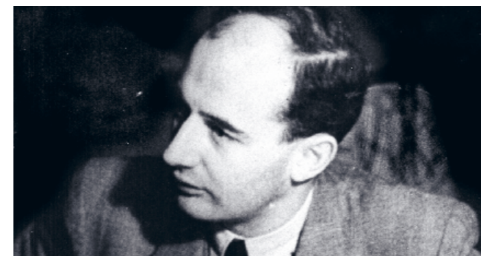
Efter Eichmann-rättegången 1961 började Yad Vashem hedra dem som räddade judar. Danmarks folk och kung, samt Raoul Wallenberg var bland de första som hedrades.

Förra året tog arbetet med Raoul Wallenberg Park fart ordentligt. Hjälp oss att färdigställa Raoul Wallenberg Park utanför Jerusalem under det här året – 80 år efter att den svenske diplomaten utförde sitt hjältedåd i Budapest. □