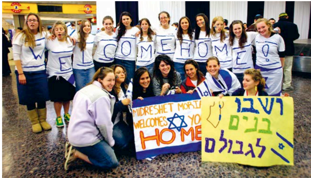
Nordamerikanska immigranter från tidigare år välkomnas till Israel.

för att vara i Frankrike för att de är judar, och de tog ner sina mezuzah, säger Pachter och syftar på pergamentsrullarna som sätts på dörrposterna i många judiska hem.