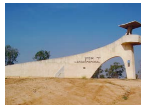
Anzac Memorial är ett monument i Be'eri-skogen till minne av de fallna soldaterna från Australien och Nya Zeeland när Beer Sheva intogs av brittiska imperiet under första världskriget.

På platsen finns även ett monument över judarna i Bagdad, varifrån några av Be'eris grundare kom. Våren 1941 försök-