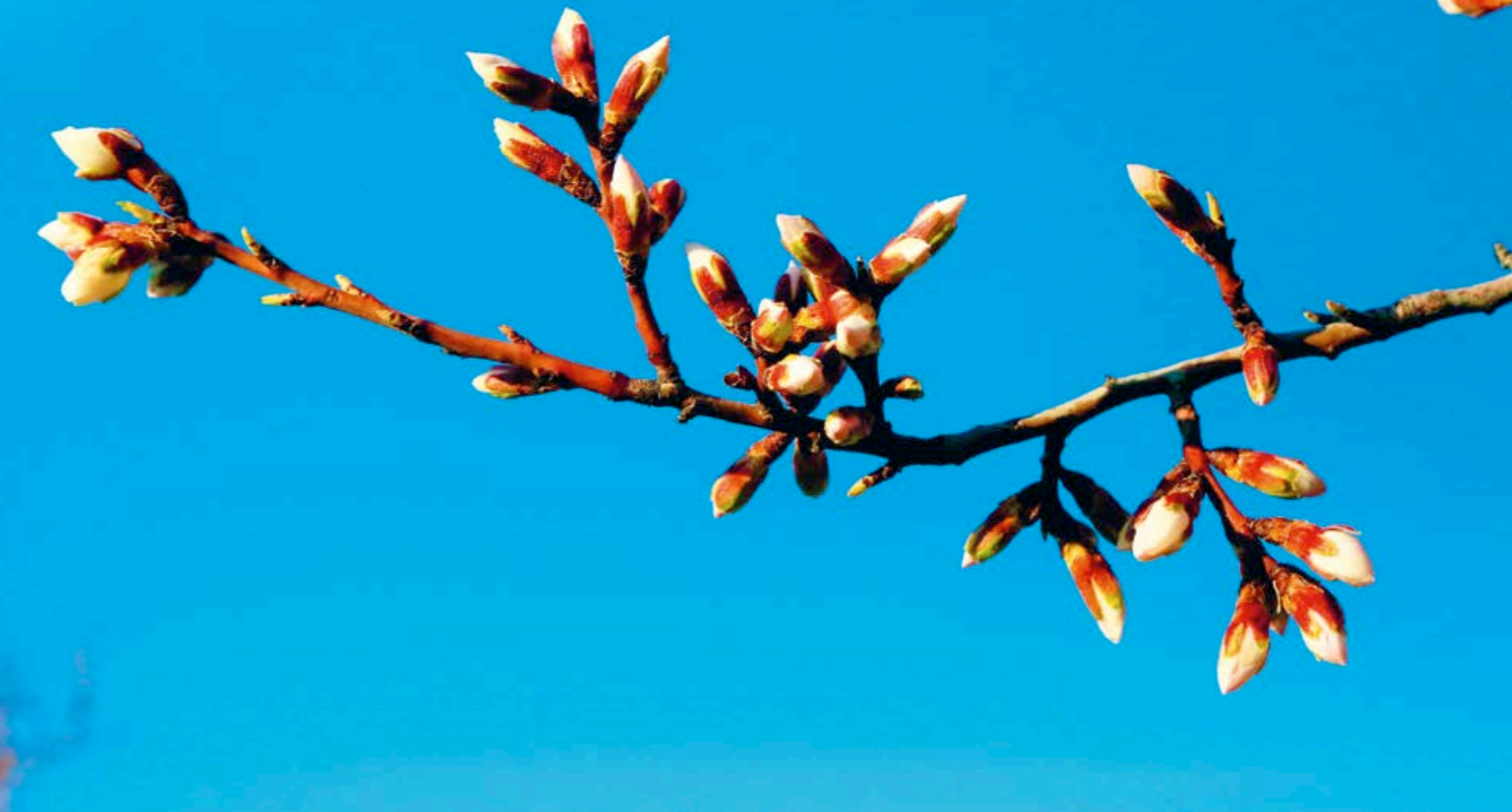
Den femtonde i månaden Shvat, som i år infaller den 25 januari, firas den judiska högtiden Tu Bishvat, trädens nyår. Då inleder fruktträden sin blomning och först av alla träd som blommar är mandelträdet.

” När han sa adjö till sina vänner gjorde Raoul följande kommentar angående sin uppgift: ”Jag ska försöka rädda så många liv som möjligt från Dödens klor.”