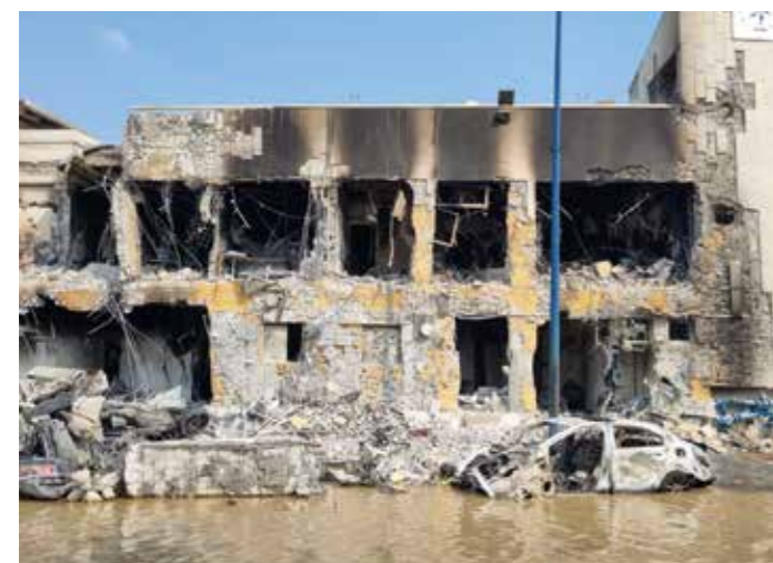
Resterna av polisstationen i Sderot som förstördes av strider mellan Hamas-terrorister och israeliska försvarsmakten.