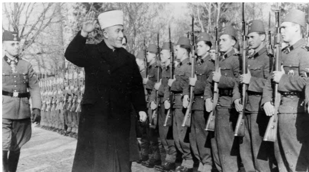
SS-befälet och stormuftin Haj Amin al-Husseini rekryterade SS-män från Balkan, Sovjet, Mellanöstern och Nordafrika.

I samband med massakern den 7 oktober lovade Hamas att terrorådet var början till