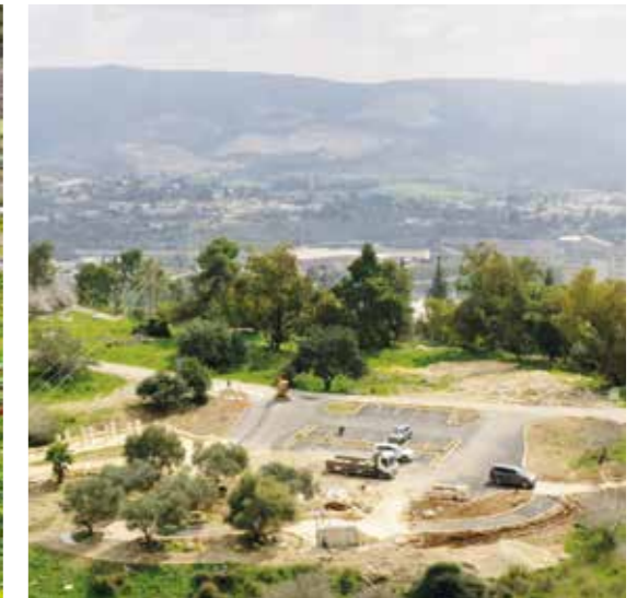
En översiktsbild av delar av parken.

Arbetet med Raoul Wallenberg Park några mil utanför Jerusalem har tagit viktiga steg framåt vilket innebär att parken enligt planerna kommer att stå klar nu i maj.