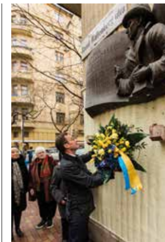
Sveriges statsminister fäster upp en krans vid Raoul Wallenbergs minnesplats i Budapest.