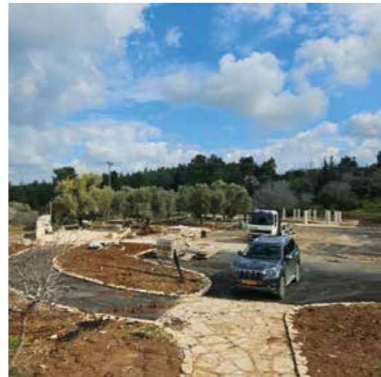
Parkering åtgärdas och området handikappanpassas.