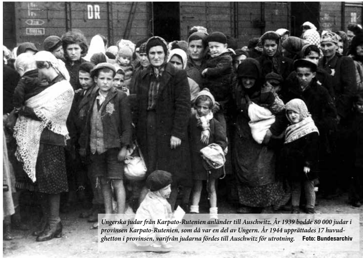
Ungerska judar från Karpato-Rutenien anländer till Auschwitz. År 1939 bodde 80 000 judar i provinsen Karpato-Rutenien, som då var en del av Ungern. År 1944 upprättades 17 huvudghetton i provinsen, varifrån judarna fördes till Auschwitz för utrotning.

För 80 år sedan, den 19 mars 1944, intog Nazityska trupper Budapest. Målet var att utplåna den största kvarvarande judiska befolkningen i Europa – Ungerns drygt 800 000 judar.