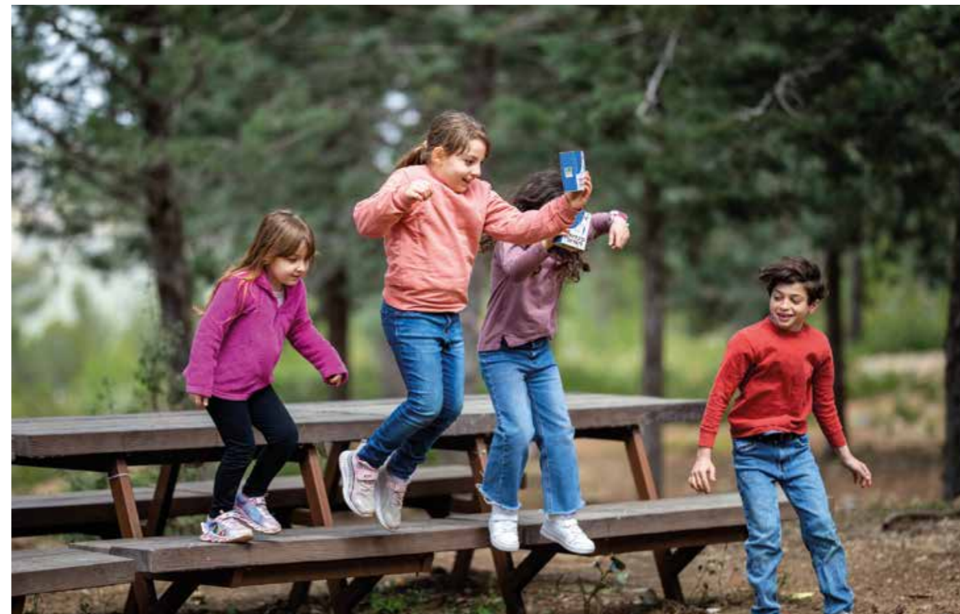
Be'eri-skogen fungerar som ett viktigt grönt bälte och är en fristad för rekreation och vandringar.

Löftet har brutits och Hizbollah har byggt upp ett stort raketlager och en gigantisk terroriststyrka, samt ett stort antal militära positioner ända fram till gränsen. FN-resolutionen lovade även att en förstärkt FN-styrka (upp till 15 000 personer) skulle hjälpa Libanon att hålla södra Libanon fritt från vapen och militärstyrkor som inte tillhörde den