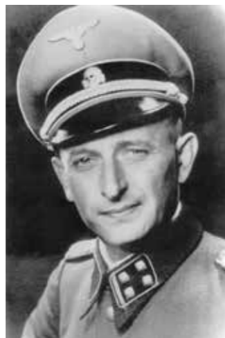
Adolf Eichmann förde protokoll i Wannsee i januari 1942.