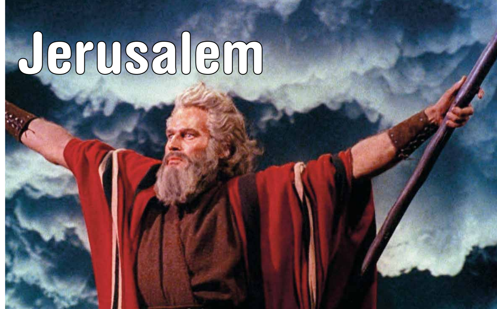
Skärmdump från DVD:n ”The Ten Commandments” där Charlton Heston spelar Moses, i samband med filmens 50-årsjubileum år 2006.

Berättelsen om Israels barns uttåg ur Egypten har inte bara format judendomen utan stora delar av den västerländska kulturen och rättsuppfattningen, som vilar på judisk-kristen etik och moral.