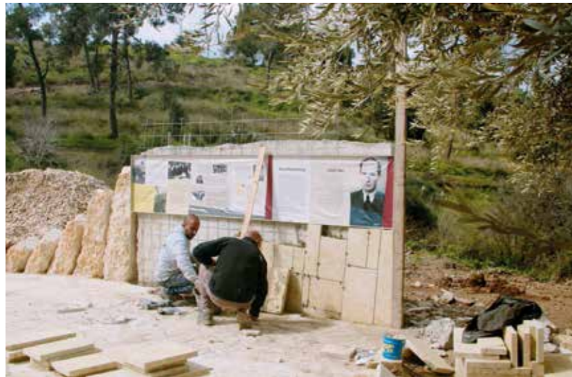
En presentation av Raoul Wallenberg tar form i parken.

”Tack för att du hjälper oss att ta de sista stegen i processen med att färdigställa parken”