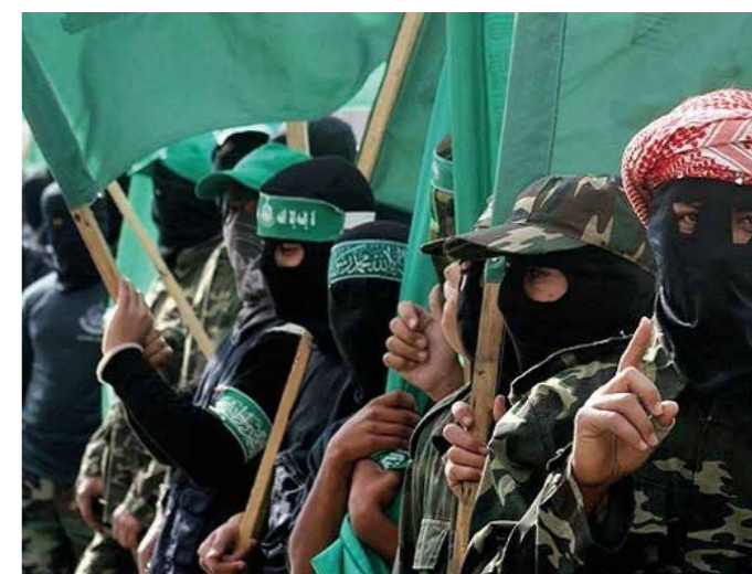
Hamas har sina rötter i det Muslimska brödrskapet som samarbetade med Hitler under andra världskriget.

Egypten var en av de främsta destinationerna för tyska nazisters flykt. Omkring 2