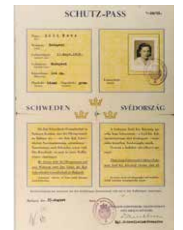
Skyddspass räddade tiotusentals.

Därför är det på tiden att ge Raoul Wallenberg och UD:s byråkratiska motstånd mot Förintelsen dess rättmätiga plats i svensk hägkomst av Förintelsen. □