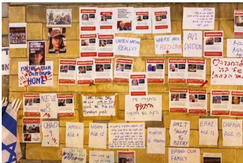
En vapenvila kan lätt uppnås den dag som Hamas släpper gisslan.

I dagliga demonstrationståg över hela Sverige ropas det aggressiva ramsor mot den judiska staten. Vad betyder det när man i palestinska demonstrationer ropar ”From