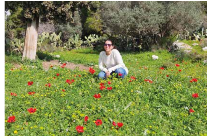
Parken ligger i ett populärt strövområde .