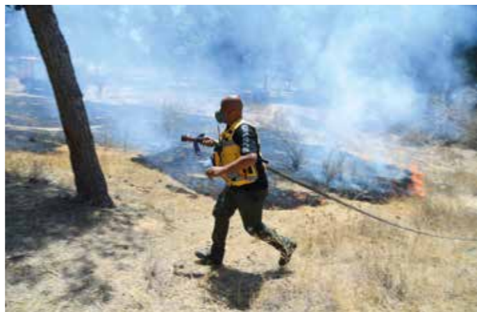
Brandskadorna är omfattande i södra Israel, på grund av brandbomber och missiler från Gaza.