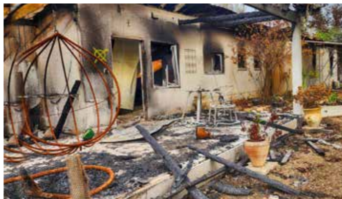
Förstört och utbränt bostadshus i Nir Oz.

Keren Kajemet har en rad projekt i de områden som utsattes för Hamas massaker den 7 oktober. Israel siktar på att nästan alla evakuerade från söder ska ha återvänt i