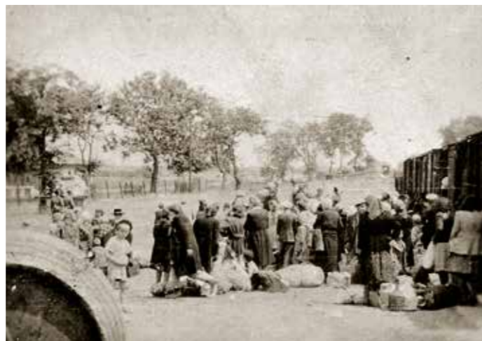
Judar i Soltvadkert i juni 1944 som ska deporteras till Auschwitz.